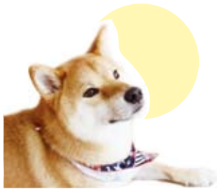
避妊手術により犬の乳腺腫瘍の予防効果